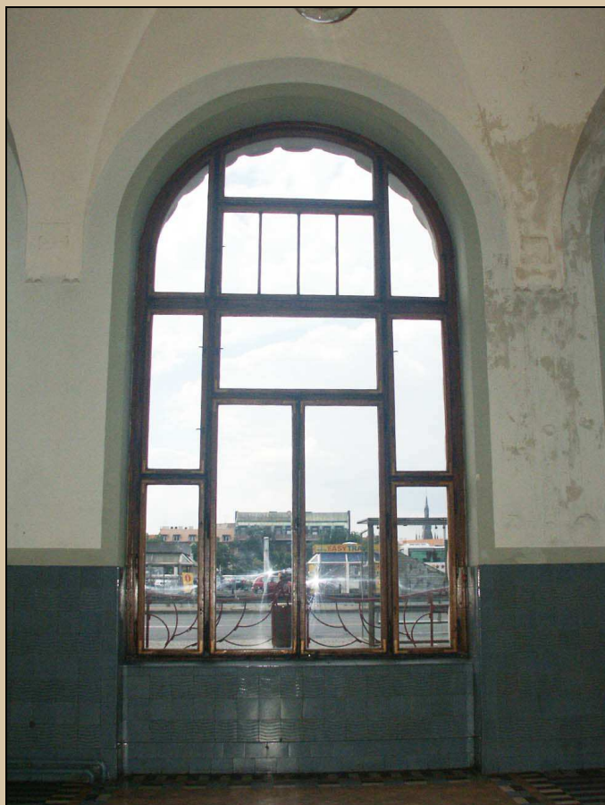
pohled na okno z interiéru