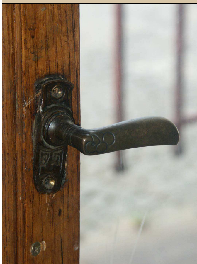
klička, původní secesní